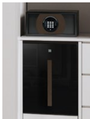
Bronze de minuit (HS-40 mini bar & coffre-fort SBOX)