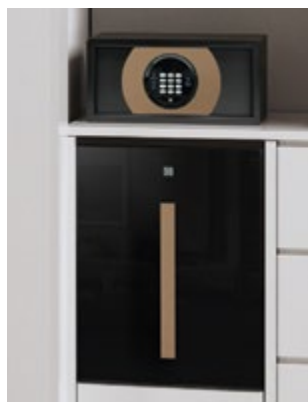
Sable du désert (HS-40 mini bar & coffre-fort SBOX)