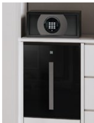
Elite titane (HS-40 mini bar & coffre-fort SBOX)