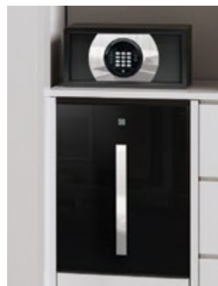
Miroir (HS-40 mini bar & coffre-fort SBOX)