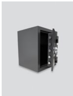
6 συμπαγείς ασφάλινοι πύροι