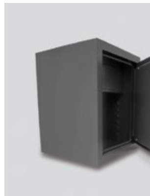
Εσωτερικό ντουλαπάκι αποθήκευσης