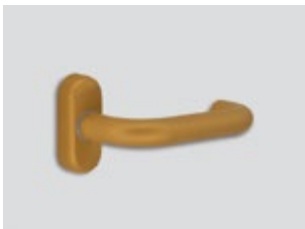
Or Mat métallique

Les finitions chromatiques de haute qualité sont testées en chambre au brouillard salin pendant 2034 heures!