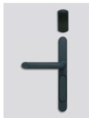
Cobalt kinetics (capuchon optionnel de cylindre)