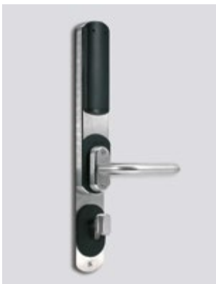
Vue intérieure / verrouillage