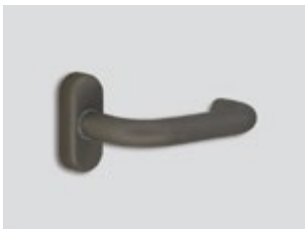
Titane Mat métallique