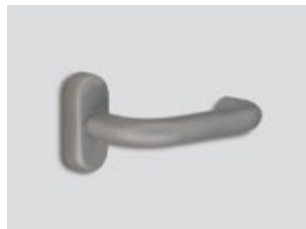
Aluminium satiné Mat métallique