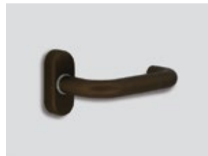
Bronze de minuit Mat métallique