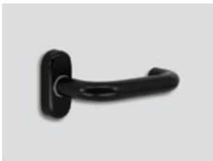
Elite* blackout Mat