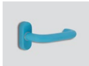
Bleu framboise Mat