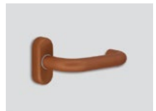
Cuivre Mat métallique

La couleur de base des serrures est l'inox satiné / Les nuances Chromatiques Suprêmes sont optionnelles