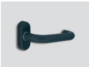
Bleu titane Mat métallique