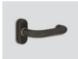
Tungstène Mat métallique