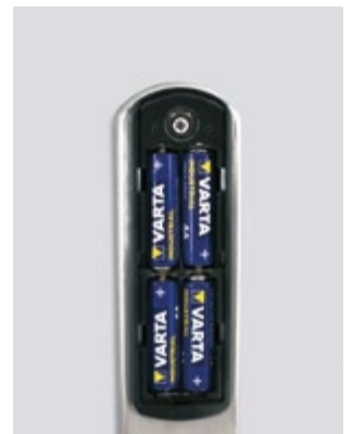
Compartment à piles