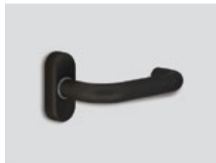
Cobalt Mat métallique