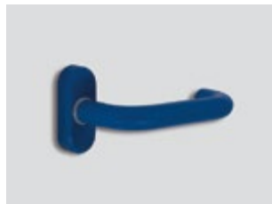
NRA bleu Mat