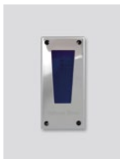
Couvercle de protection