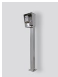
IP66 avec poteau de support