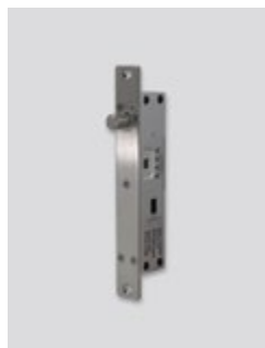
Connexion avec un pêne automatique