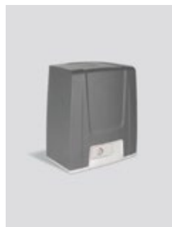
Connexion avec une porte automatique