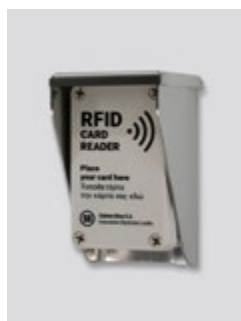
IP66 avec couvercle de protection