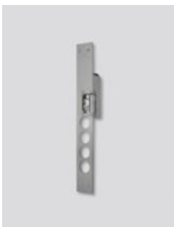
Connexion avec une gâche électrique