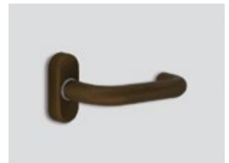
Bronze brûlé Mat métallique