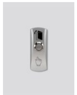
Connexion avec un bouton de sortie