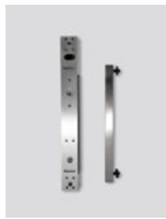
Connexion avec un électroaimant