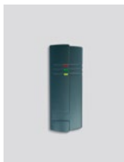
Lecteur de carte / modèle de base