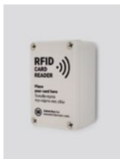
IP66 lecteur de carte