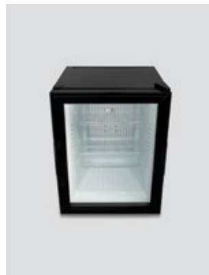
Μπροστά όψη / ράφια