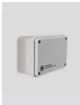
Εσωτερική συσκευή ελέγχου πρόσβασης