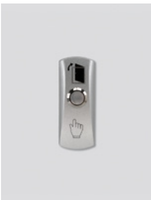
Δυνατότητα σύνδεσης με μπουτόν εξόδου