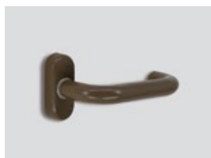
Elite* FDE Ματ