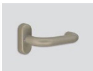
Bright nickel Μεταλλικό ματ