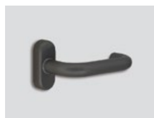
Elite* titanium Μεταλλικό ματ