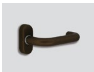
Midnight bronze Μεταλλικό ματ