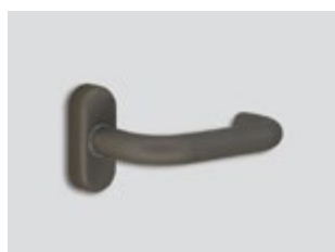
Titanium Μεταλλικό ματ