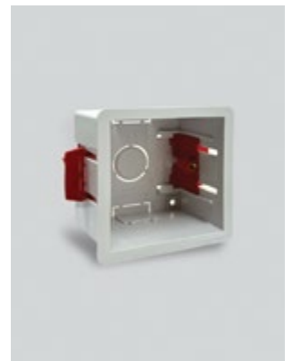
Κυτίο εντοιχισμού για γυψοσανίδες