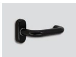
Elite* blackout Ματ