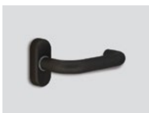
Cobalt Μεταλλικό ματ