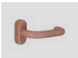
Rose gold Μεταλλικό ματ