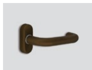
Burnt bronze Μεταλλικό ματ