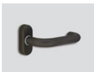
Tungsten Μεταλλικό ματ