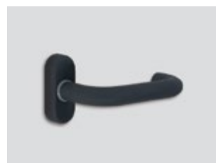
Cobalt kinetics Μεταλλικό ματ