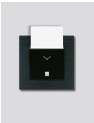
Κάρτα στην υποδοχή