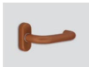
Copper Μεταλλικό ματ

Βασικό χρώμα των κλειδαριών είναι το inox satin / Οι αποχρώσεις supreme chromatics είναι προαιρετικές.