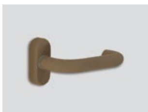
Desert sand Ματ