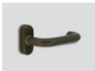
Elite* moss Ματ