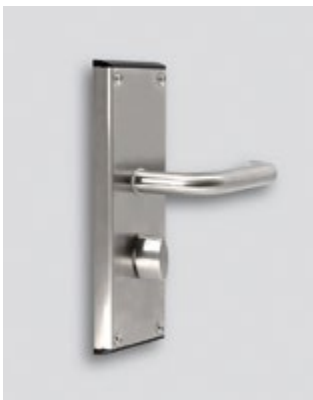
Εσωτερική όψη / κλειδωμα